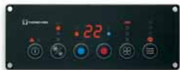
ClimaAIRE I D