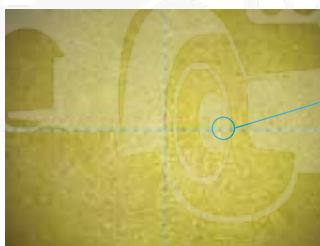
Набивка фильтра из стекловолокна

Больше частиц удаляется = чище хладагент и масло = увеличенный срок службы компрессора