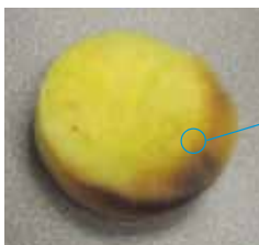
Набивка фильтра из стекловолокна

В осушителях, производимых конкурентами, в качестве набивки фильтра используется стекловолокно, тогда как в осушителе компании Thermo King применяется высококачественный фильтрующий материал. Как известно, из стекловолокна выпадают отдельные волокна, которые могут засорить отверстия ТРВ и электроклапана, расположенных после фильтра-осушителя, препятствуя надлежащему охлаждению. К преимуществам конструкции компании Thermo King относятся практически полное отсутствие опасности перегрева (так как поддерживается охлаждающий поток) и снижение риска потери груза из-за несоответствующего охлаждения.