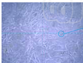
Набивка фильтра компании Thermo King

Набивка фильтра компании Thermo King захватывает на 60 % больше частиц, так что хладагент и масло поддерживаются в более чистом состоянии, а это приводит к увеличению срока службы компрессора.